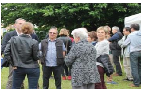
Le 3 juin, repas des voisins