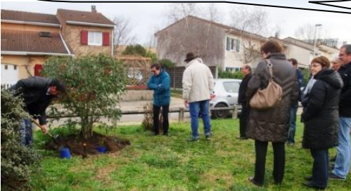
Le 30 janvier, Assemblée Générale